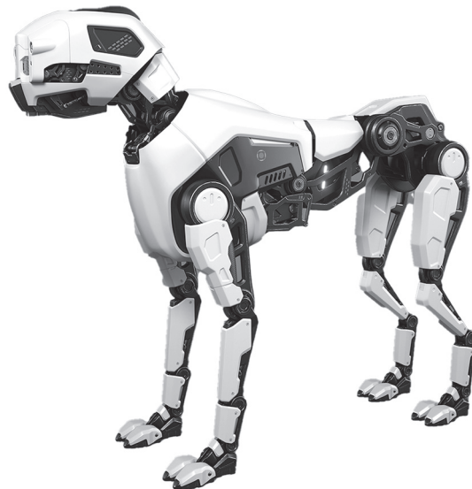
Figura 3: HoundBot

Amanda Aguiar, jefa de la Policía de Madrid, explicó que HoundBot se utilizará para obtener pruebas mediante sensores y cámaras para crear una imagen tridimensional (3D) de la escena del delito (véase la Figura 4 ).