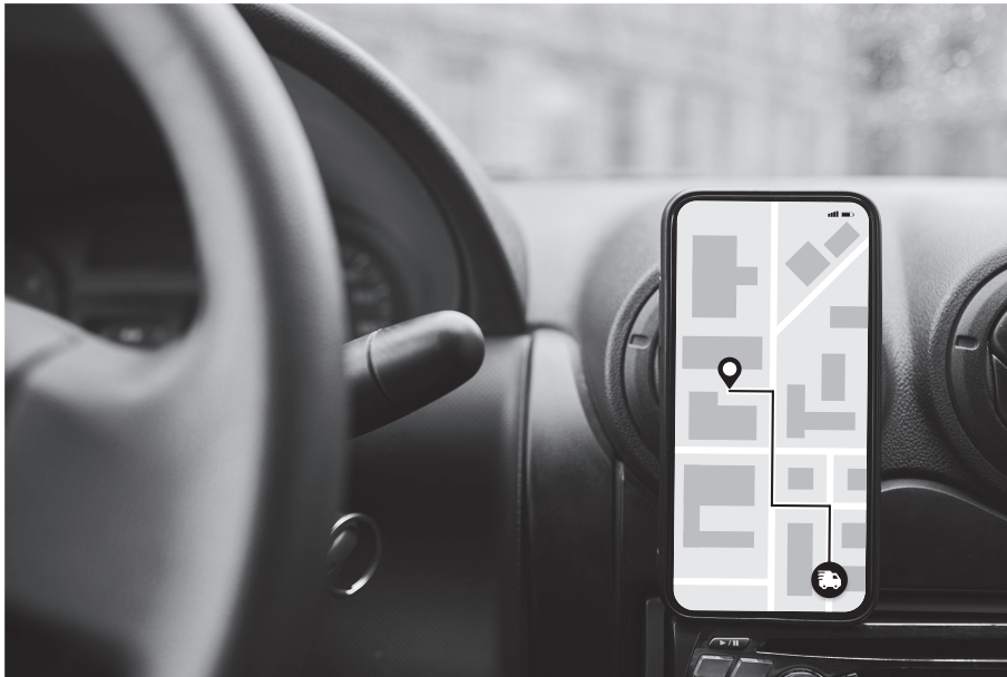
Figura 5: Un sistema de optimización de rutas en un teléfono móvil

Mientras que los nuevos repartidores/as han acogido con satisfacción la introducción de un sistema digital de optimización de rutas, algunos repartidores/as experimentados preferirían utilizar los conocimientos que han adquirido a lo largo de muchos años.