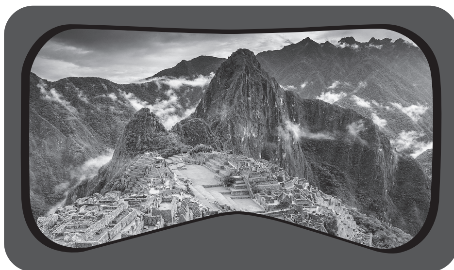
Figura 1: Una imagen de Machu Picchu tomada del recorrido histórico en RV

Los recorridos históricos en RV son un ejemplo de digitalización.